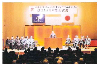
設立30周年記念式典のようす