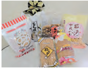
(写真は6種類セット)

(株)いたに萬幸堂さんから会員さんだけに特別価格で人気のおせんべい詰め合わせを販売していただけることになりました。