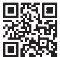
亀の瀬トンネル内プロジェクションマッピング 「日本遺産『龍田古道・亀の瀬』光の旅路」