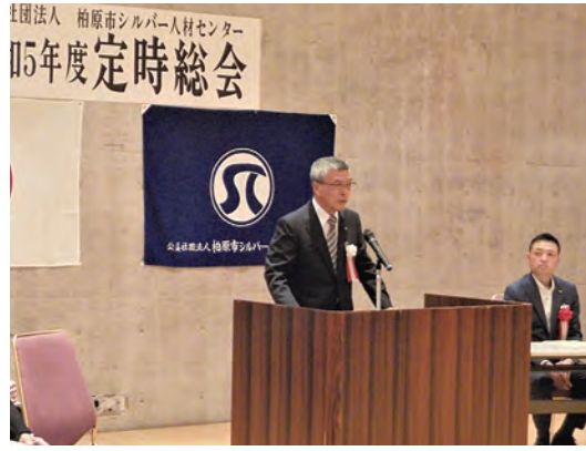
笠井理事長のあいさつ

6月14日（水）に公益社団法人柏原市シルバー人材センターの令和5年度定時総会が柏原市民文化会館（リビエールホール）において開催されました。